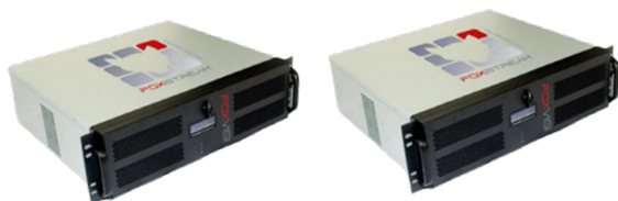
Gamme FoxServer jusqu'à 100 voies